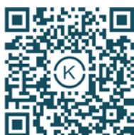
Kernspin München Ost