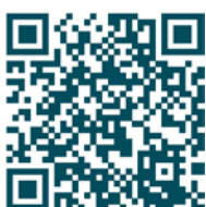
Mit WhatsApp direkt zur Buchung