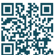
Wirbelsäulenzentrum München Ost

Weitere Informationen und den Buchungslink für Doctolib finden Sie auf unserer jeweiligen Homepage: