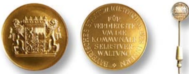
Bayerische Verdienstmedaille „Kommunale Selbstverwaltung Gold“ mit zugehöriger Reversnadel

Wir bitten Sie, das Formular für die Verleihungsvorschläge sorgfältig auszufüllen und die kommunalen Funktionen sowie die bereits erhaltenen Ehrungen vollständig und auf aktuellem Stand anzugeben.