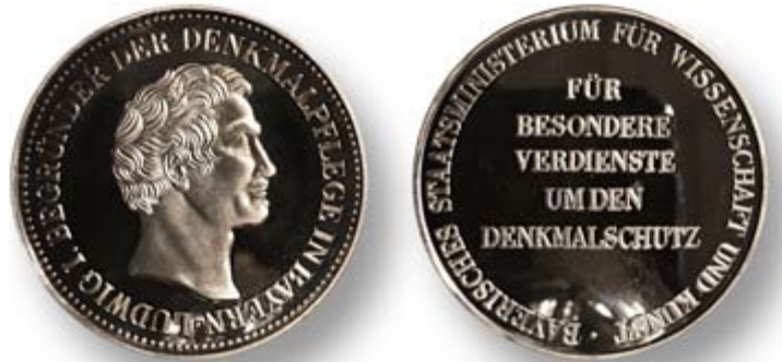
Bayerische Denkmalschutzmedaille 2021

Auf der Homepage der Gemeinde Putzbrunn finden Sie das entsprechende Vorschlagsformular, welches Sie bei der Gemeinde einreichen können.