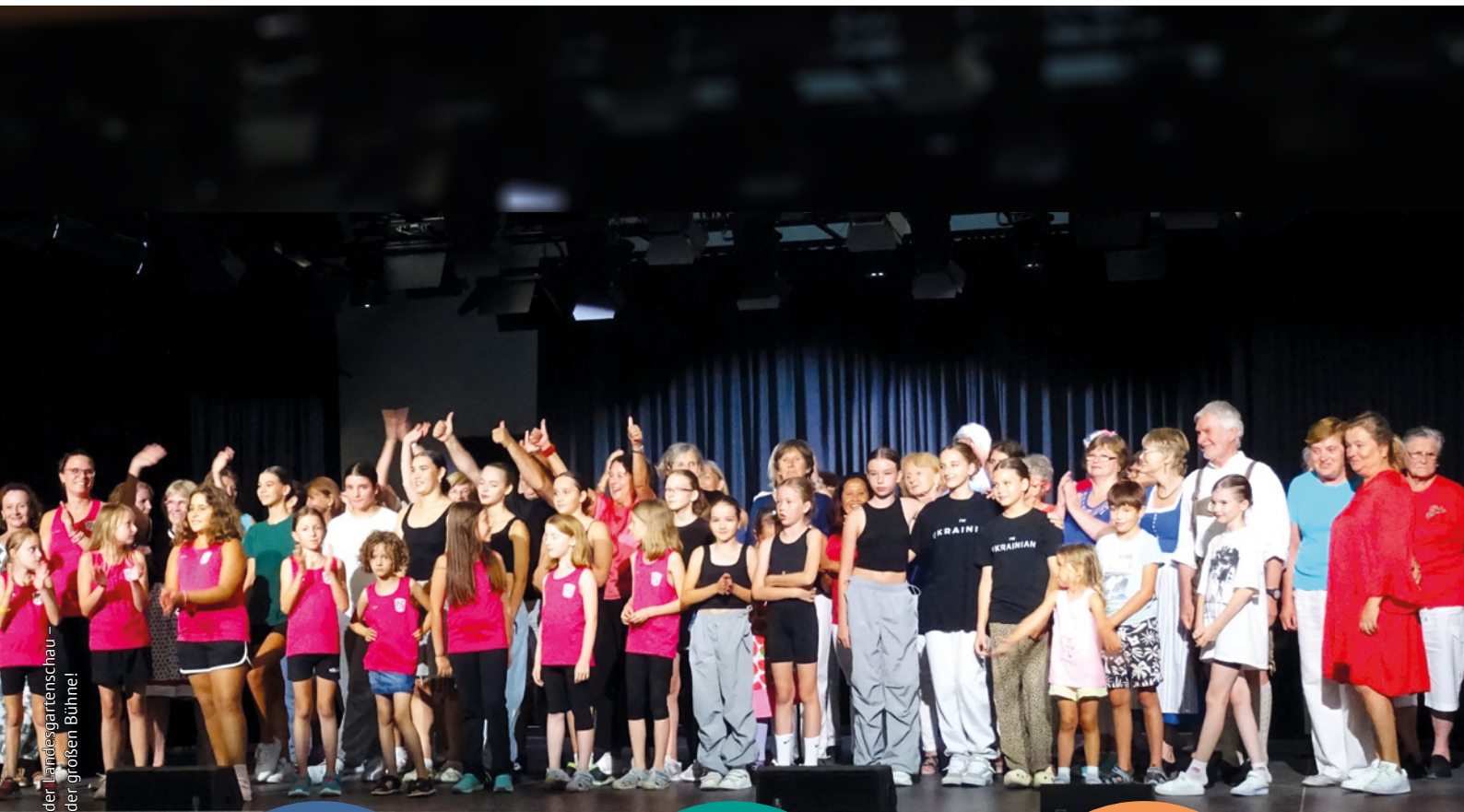
Putzbrunn zu Gast auf der Landesgartenschau - fast 100 Tänzer*innen auf der großen Bühne!

Aktuelle Informationen aus unserer Gemeinde Putzbrunn | Solalinden | Oedenstockach | Waldkolonie