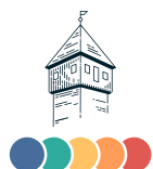
Edwin Klostermeier Erster Bürgermeister