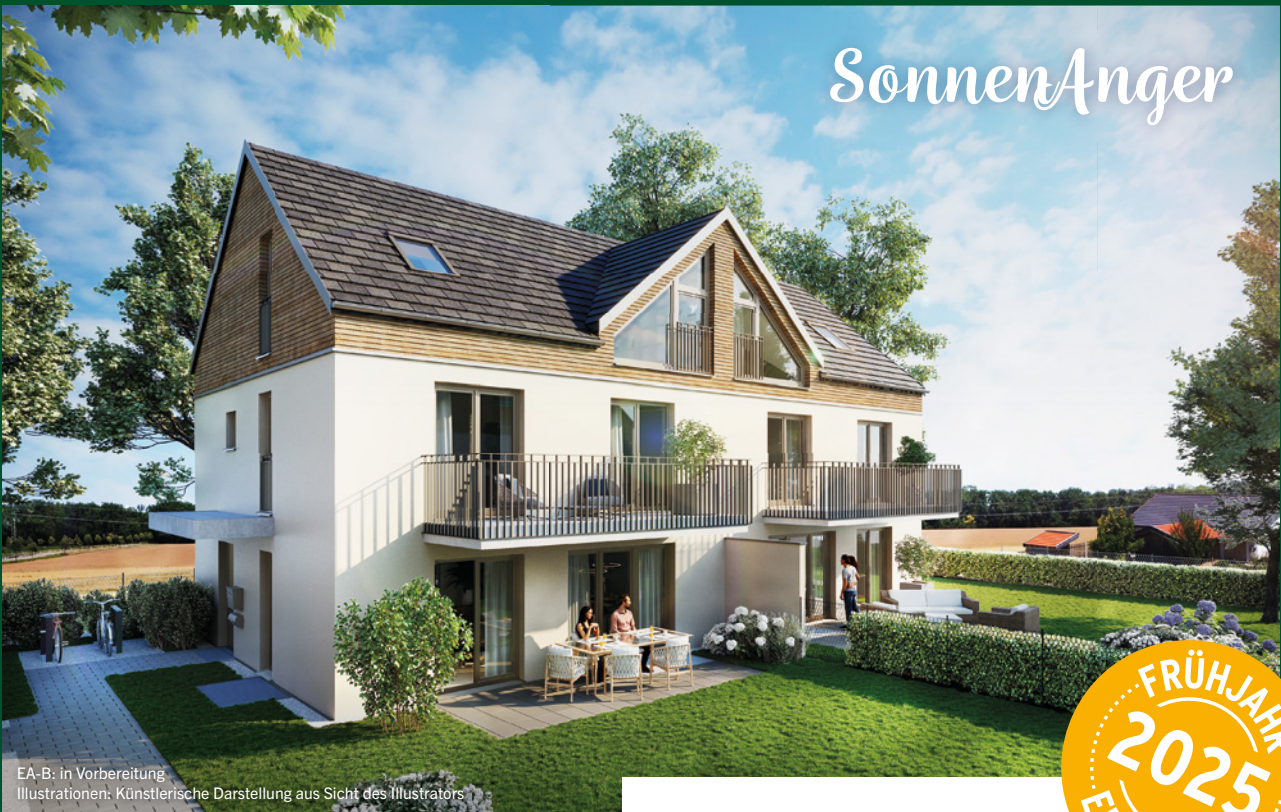
EA-B: in Vorbereitung Illustrationen: Künstlerische Darstellung aus Sicht des Illustrators