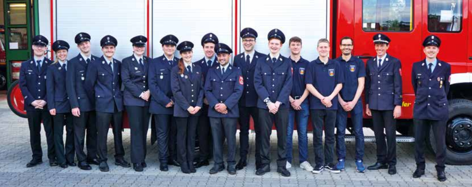
Zwischenprüfung - modulare Truppausbildung am 02.06.2022

Modulare Truppausbildung und Jugend-Leistungsprüfung