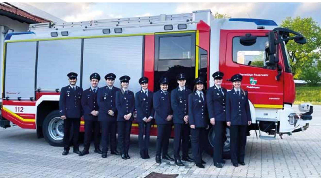
Jugend-Leistungsprüfung am 13.06.2022