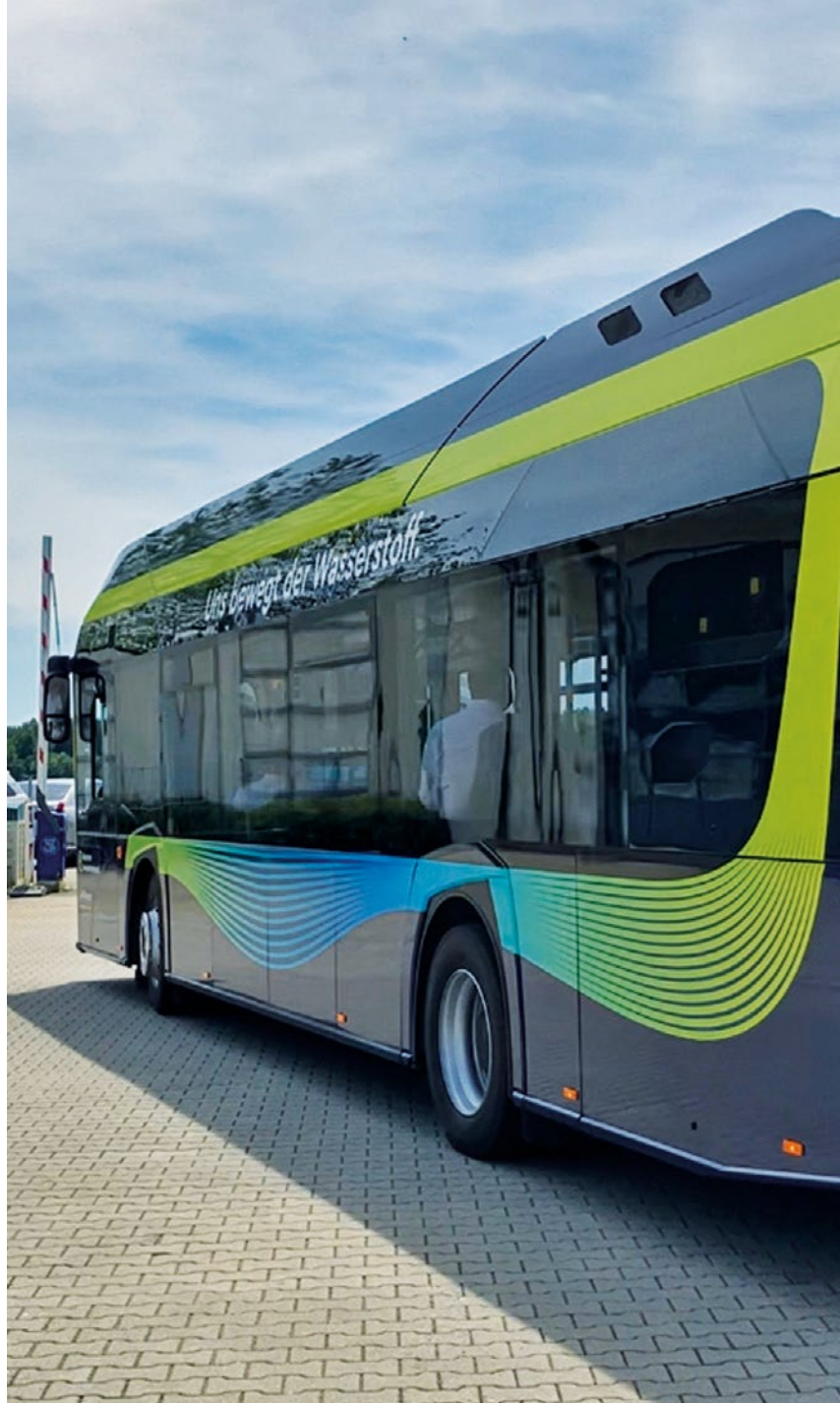
Im Anschluss an die Vorstellung luden die Verkehrsunternehmen zu einer Probefahrt mit den neuen Brennstoffzellen-Bussen, die als ersten Busse im neuen MVV-Design unterwegs sein werden.