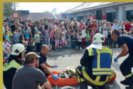
>> NICHT VERPASSEN << „Tag der offenen Tür“ bei der FFW Putzbrunn am 19.9.2015