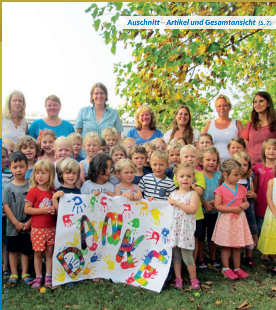
Ausschnitt – Artikel und Gesamtansicht (S. 7)