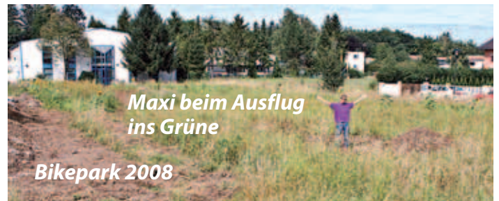
Maxi beim Ausflug ins Grüne