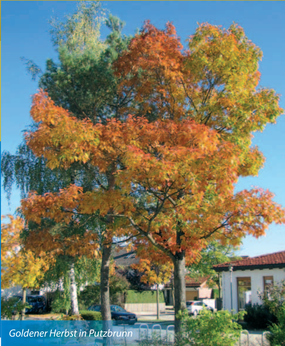
Goldener Herbst in Putzbrunn