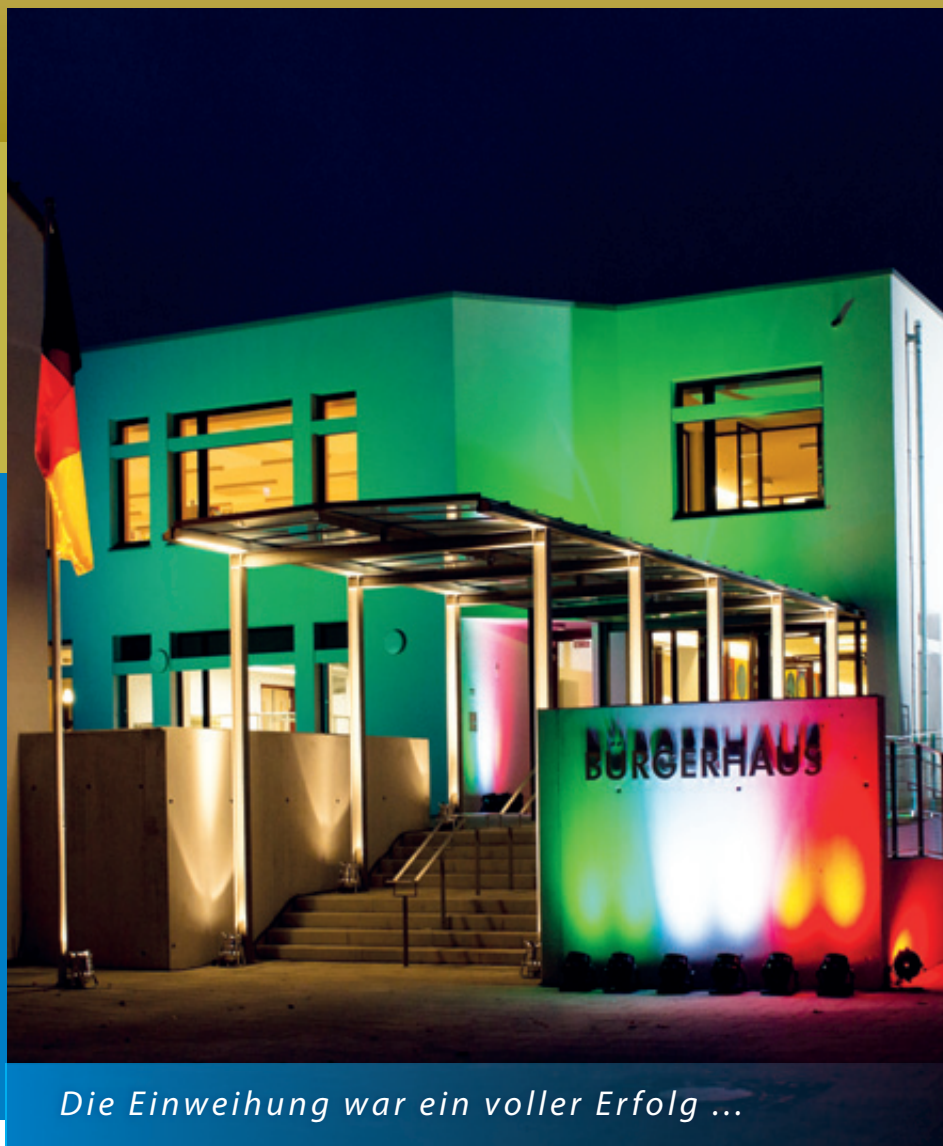
Die Einweihung war ein voller Erfolg ...

Putzbrunn · Solalinden · Oedenstockach · Waldkolonie