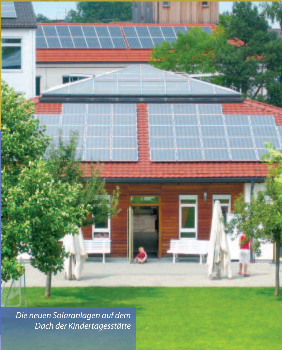
Die neuen Solaranlagen auf dem Dach der Kindertagesstätte

Putzbrunn · Solalinden · Oedenstockach · Waldkolonie