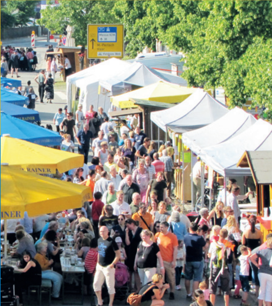
Putzbrunn hat gefeiert – Gemeinsam ...