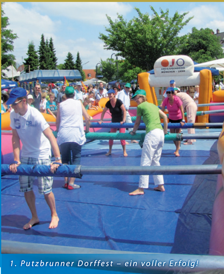
1. Putzbrunner Dorffest – ein voller Erfolg!