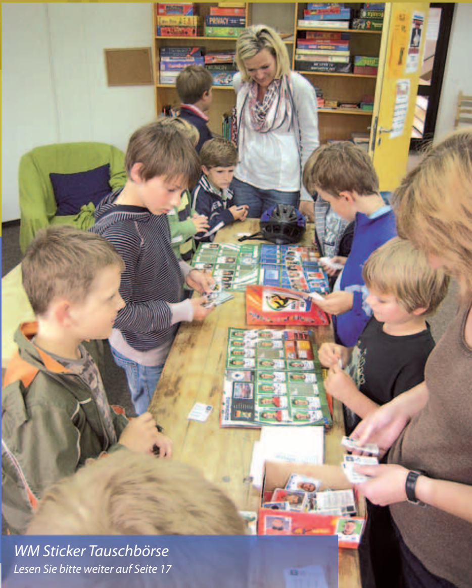
WM Sticker Tauschbörse Lesen Sie bitte weiter auf Seite 17

Putzbrunn · Solalinden · Oedenstockach · Waldkolonie