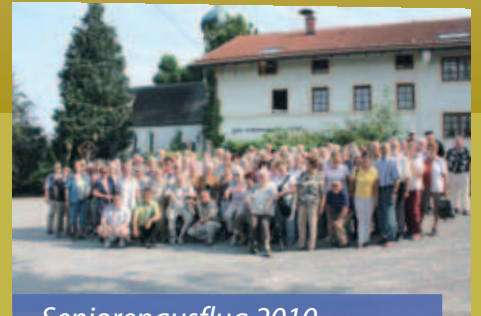
Seniorenausflug 2010 siehe Seite 2