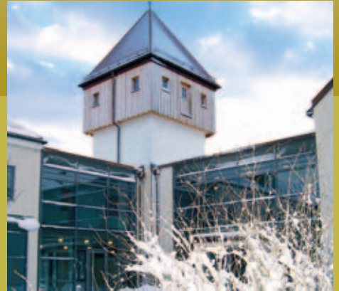
Winterlandschaft bei Putzbrunn