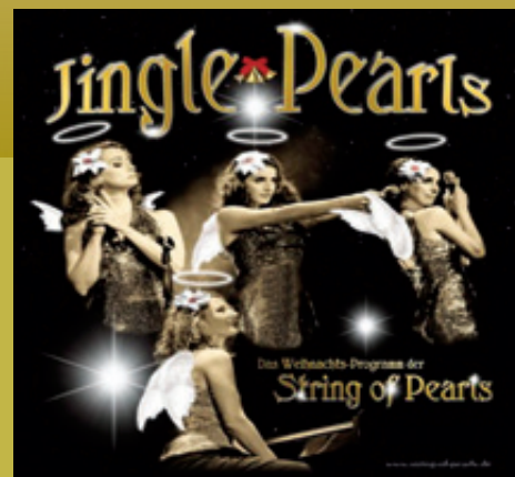
Seniorenweihnachtsfeier in Putzbrunn (mehr in Jan.-Ausgabe)