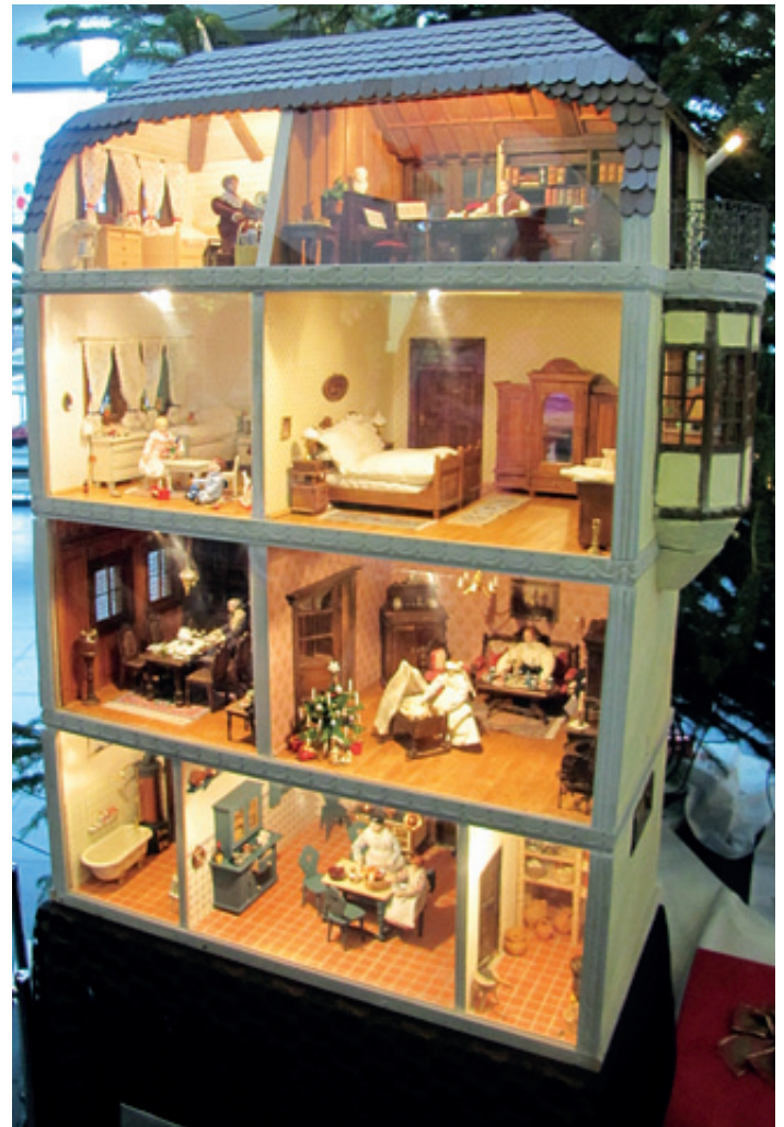
Puppenhaus aus dem 19. Jahrhundert

Wie immer war unser Christkindlmarkt an beiden Tagen zahlreich besucht und der Erlös der Verkäufe kommt größtenteils wieder örtlichen sozialen Zwecken zu Gute.