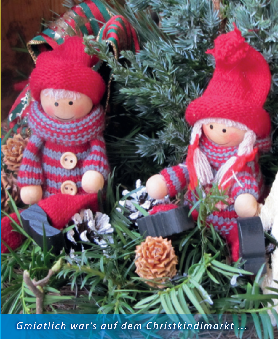
Gmütlich war's auf dem Christkindlmarkt ...