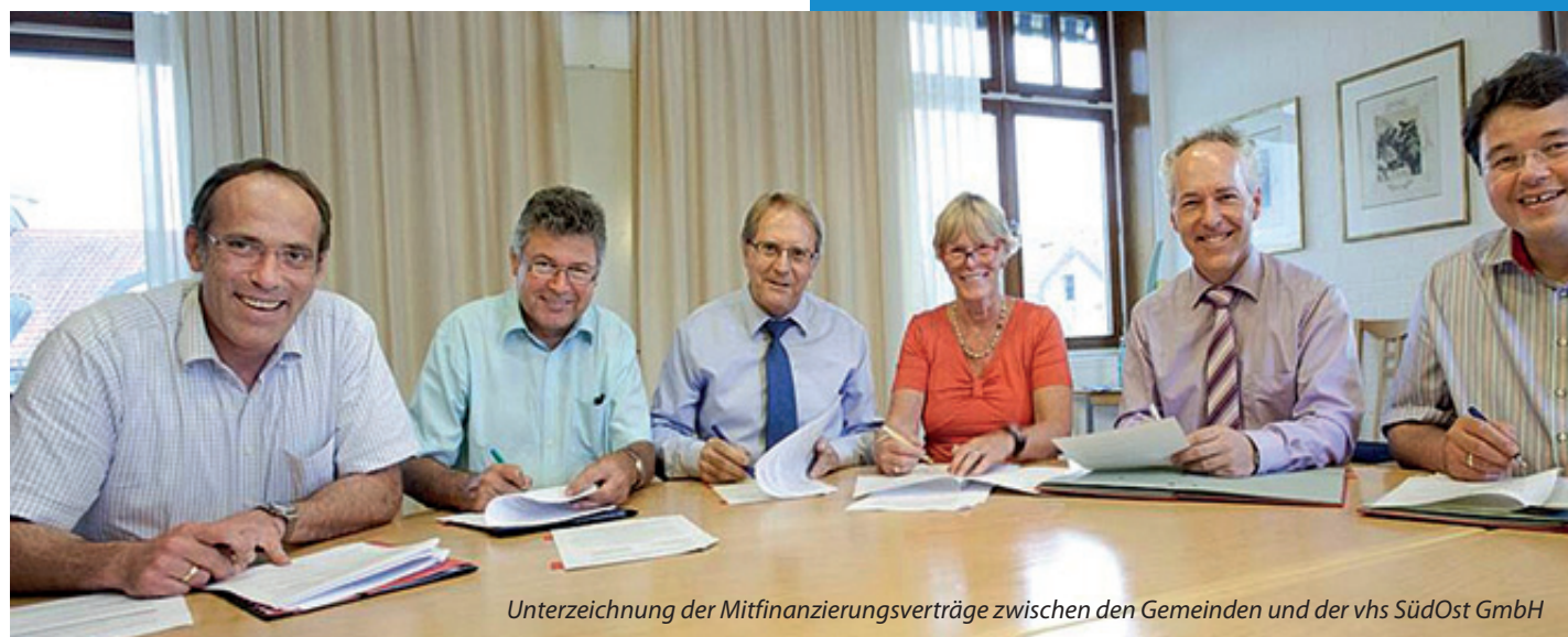
Unterzeichnung der Mitfinanzierungsverträge zwischen den Gemeinden und der vhs SüdOst GmbH