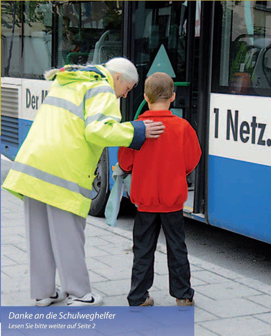
Danke an die Schulweghelfer Lesen Sie bitte weiter auf Seite 2

Putzbrunn · Solalinden · Oedenstockach · Waldkolonie