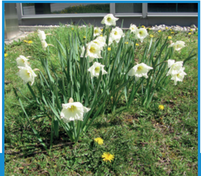
„Der Frühling hat auch vor dem Rathaus Einzug gehalten!“

Hinweis: Genauere Informationen zu einigen Veranstaltungen erhalten Sie auf unserer Internetseite www.putzbrunn.de -> Aktuelles -> Veranstaltungen.